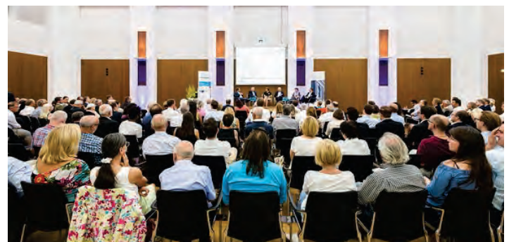
Podiumsdiskussion zum Thema in der IHK-Frankfurt mit Haus&Grund-Frankfurt