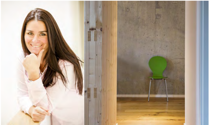
„Mehr Kreativität durch Klarheit“

Die Reinheit der Materialien in einem klaren Konzept zusammen zu bringen, MIN -imaler Flächenverbrauch und dennoch MAX -imalen individuellen Raumbedarf zu schaffen, das verstehe ich als Baubiologin unter nachhaltigem Bauen. Wir sehen uns in der Verantwortung die Welt auch noch für unsere Kinder lebenswert zu erhalten.