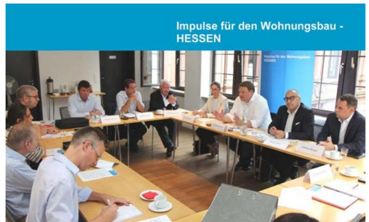
Pressegespräch der Impulse für den Wohnungsbau – HESSEN im Frankfurter PresseClub

Die Menschen in Hessen benötigen dringend mehr bezahlbaren Wohnraum. Die Zahlen der Baugenehmigungen gehen in besorgniserregendem Maße zurück. Damit eine Trendumkehr gelingt, muss die Landesregierung ihrer Rolle gerecht werden und sowohl bei Bestandsgebäuden als auch im Neubau deutlich mehr Engagement zeigen. Wir müssen endlich die Kosten senken und das Bauen insgesamt einfacher und schneller machen.