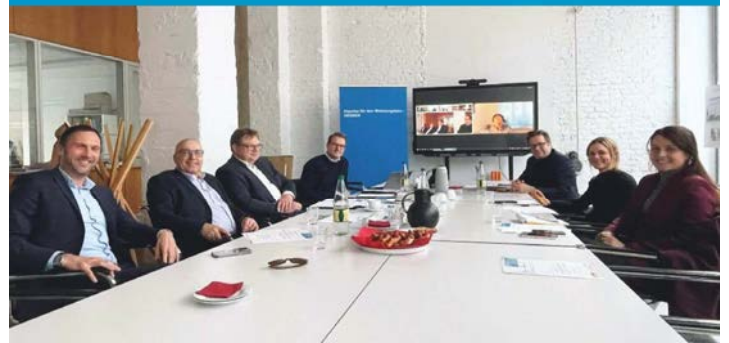
9. Sitzung Impuls für den Wohnungsbau - HESSEN

Große Zustimmung der 'Impulse für den Wohnungsbau – HESSEN' dafür, daß seitens des Wirtschaftsministeriums viele Vorschläge für Veränderungen der hessischen Bauordnung (HBO) aufgenommen wurden und jetzt eine Gesetzesvorlage auf dem Tisch liegt, die in die richtige Richtung zeigt.